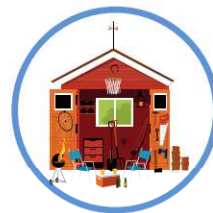
des hangars et locaux de stockage