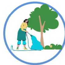
des potagers, vergers et arbres de moins d'un an de plantation